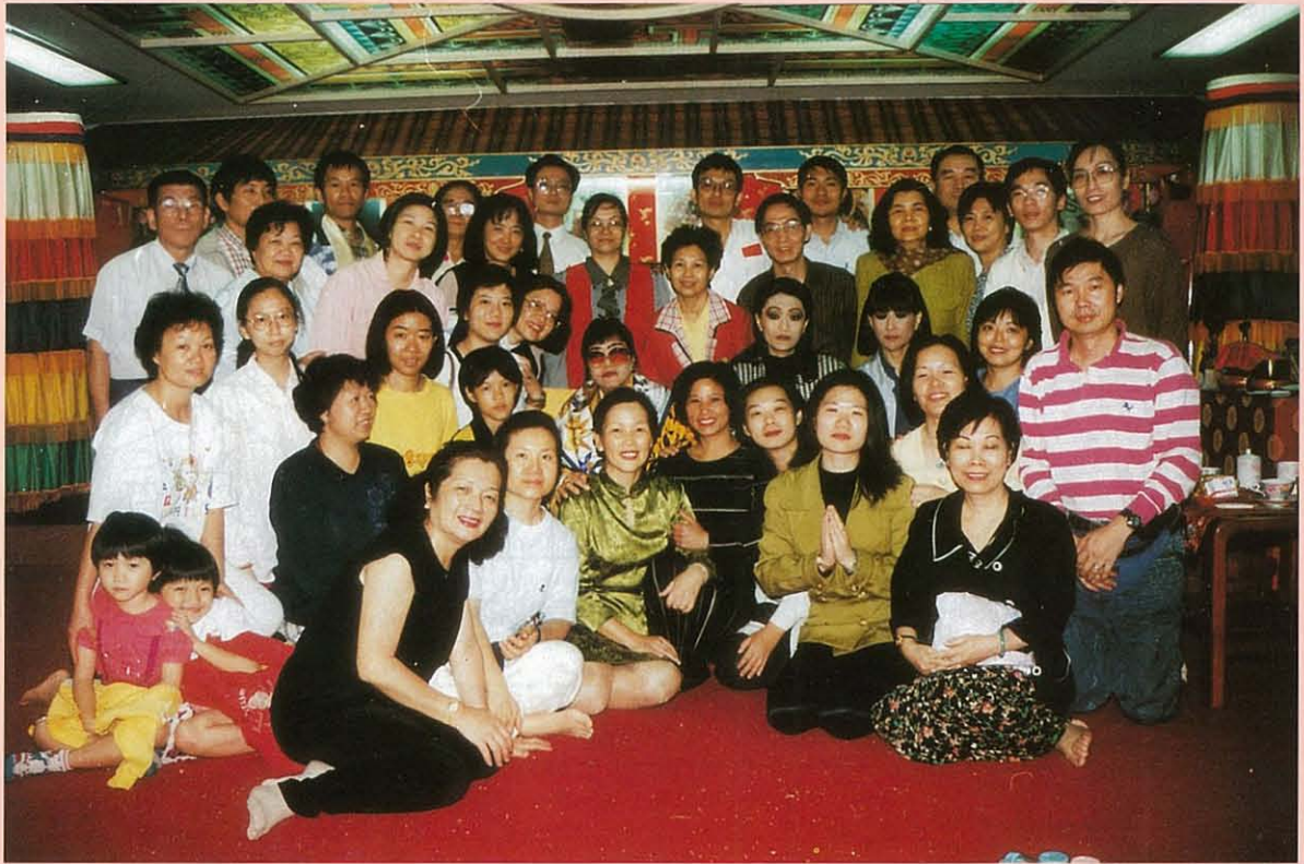
會各持加台蒞母佛珠敦