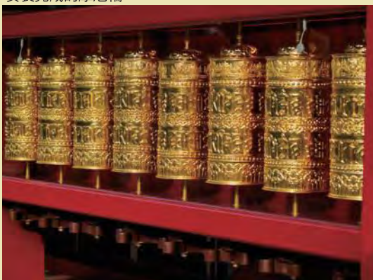
安裝完成的摩尼輪