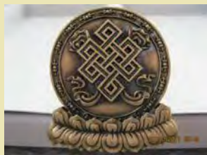
摩尼輪屋頂的八吉祥銅製瓦鐃