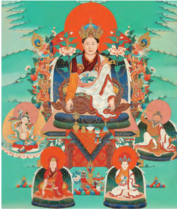
敦珠法王法相（攝自密宗山大圓滿廟壁畫）

上師大行之親授，包括繪畫壇城、進行灌頂、燒火供及勝住法等，其攝受余為弟子，慈愛之山，超越天界。