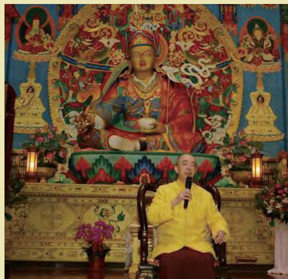
年初一上師講龍的故事

當大家聽得意猶未竟時，由蕭會長主持的「文物流通」開始了，這次上師提供了八件作工非常精美的手珠、念珠和吊飾要讓大家有機會在龍年新春積集福德資糧，拍賣所得將交由大圓滿廟所用。活動過程非常熱絡而精彩，發心的菩薩競相舉手報價，不到一會兒功夫，八件珍品全部被請購一空，上師還慈悲的和每一位得主合照留念。